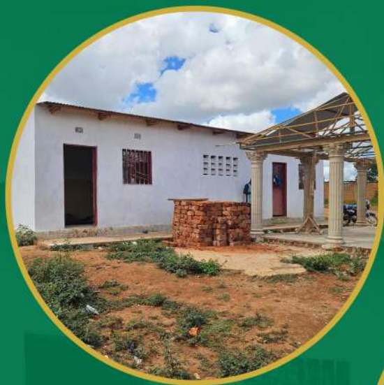
Bureau administratif du quartier kassapa en construction. Source : Photo IRDH Mars 2025