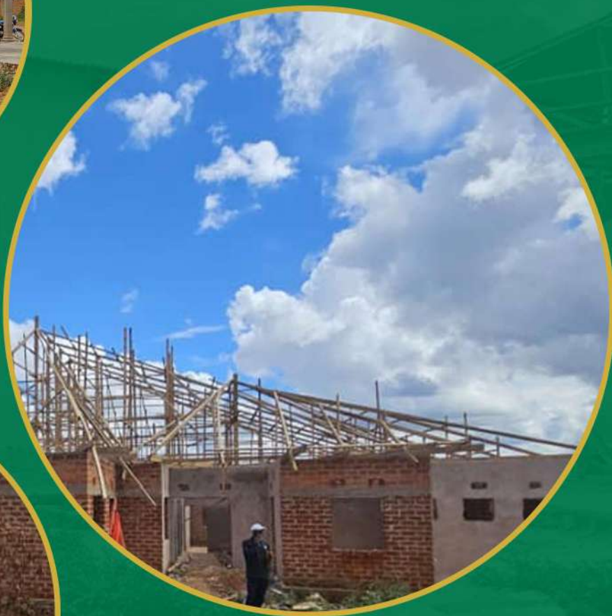
Hopital en construction à kassapa Photo IRDH Mars 2025